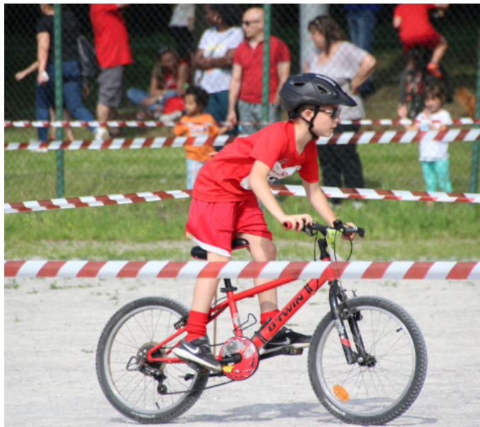
Atleta durante la gara di biathlon

Un'ulteriore conferma della validità della proposta polisportiva arriva dai numeri della nuova stagione. Sono davvero moltissime le società sportive che hanno aderito al progetto. L'Under 10 maschile si presenterà ai nastri di partenza con 24 squadre. Saranno 22 le formazioni per il calcio Under 12. Il volley Under 12 coinvolgerà 11 formazioni, 8 società parteciperanno invece al minivolley. Novità in vista per quanto riguarda la formula del campionato, ci saranno infatti alcune modifiche al regolamento generale e alle prove alternative. Tutto verrà spiegato nella riunione di presentazione che si svolgerà martedì 2 ottobre alle ore 20.45 presso la sede del CSI Como.