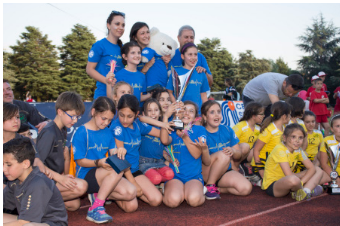
Le premiazioni durante la festa finale del polisportivo