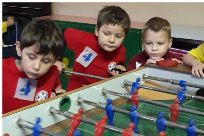
Gli atleti Under 8 impegnati in una sfida a calcetto